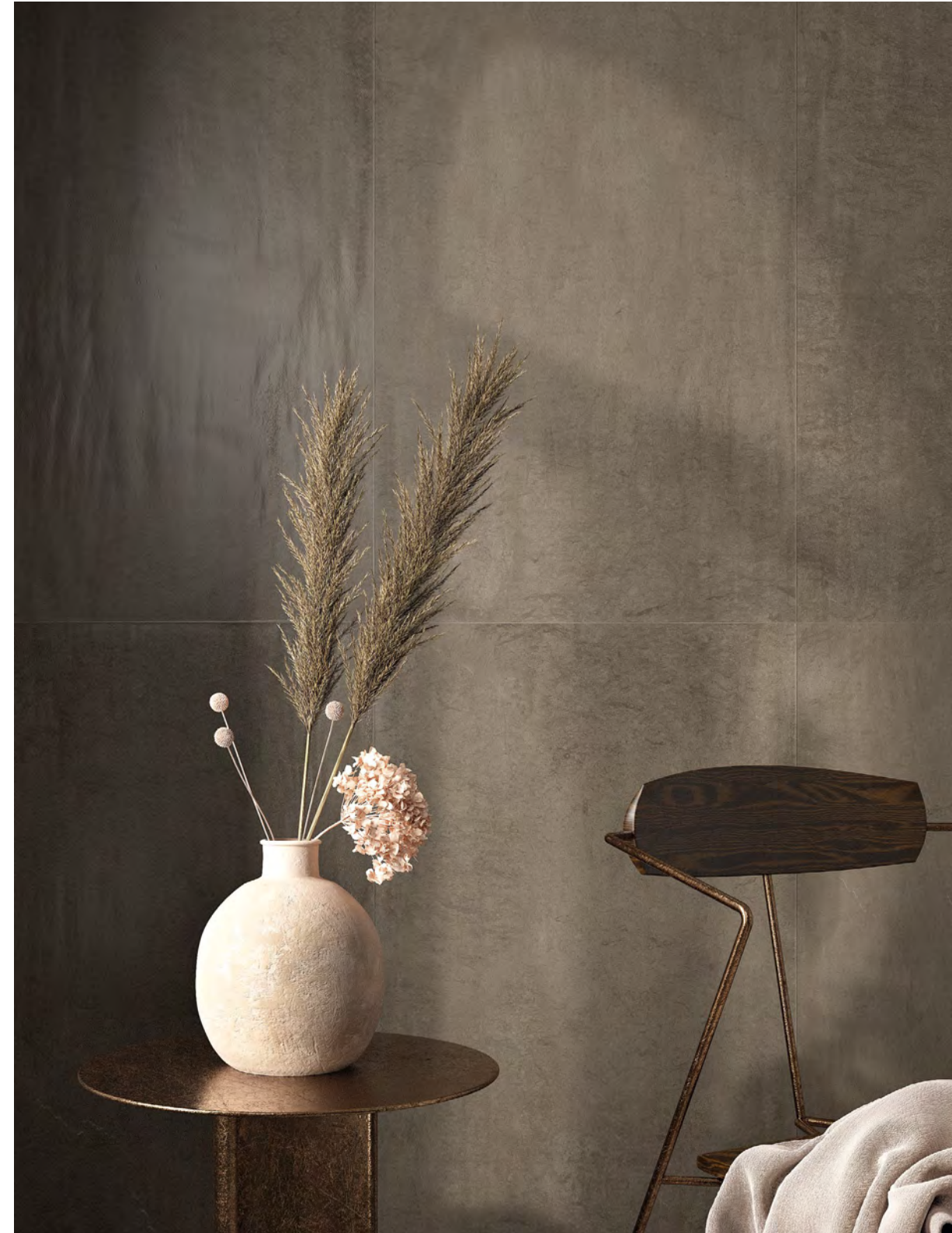
Foussana Gray Satin 60x120 / 23,6"x47,2" > Foussana Sand Satin 60x120 / 23,6"x47,2" - Sand Satin 7,5x30 / 2,9"x11,8"