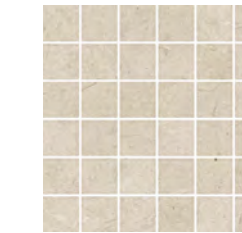
30x30 - 11,8"x11,8" 6000068 THALA satin 13 ▲