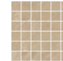
30x30 - 11,8"x11,8" G204190 SAND satin 13 ▲